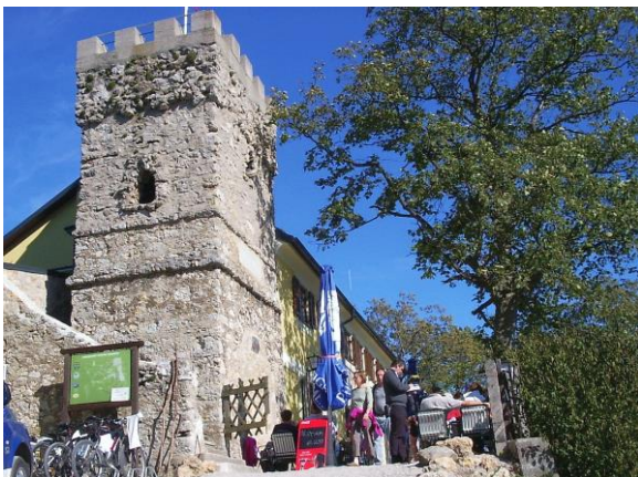
Ziel: Julienturm, Höllensteinhaus (645 m)