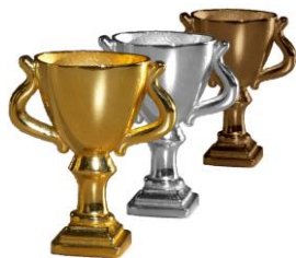
Abbildung etwa in Originalgröße

Die Preise werden von der Ögussa, der Österreichischen Gold- und Silber-Scheideanstalt zur Verfügung gestellt. Sie sind zwar klein, haben es aber dennoch in sich!